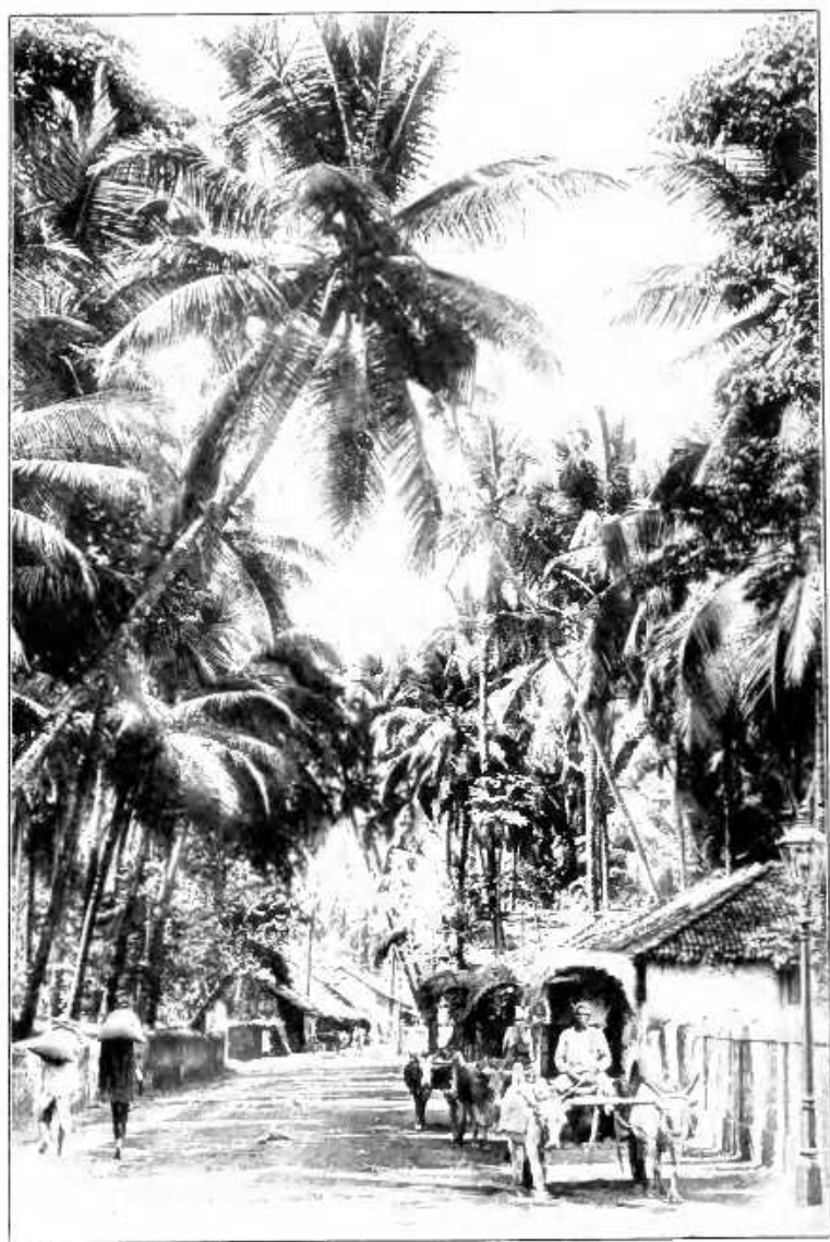
Auß der Eingeborenenstadt von Colombo