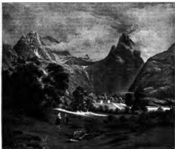
Forfatterens Fødested paa Næs i Romsdalen.